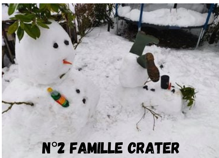
N°2 FAMILLE CRATER

LE BONHOMME DE L'ÉQUIPE SOIGNANTE DU CHÂTEAU DES CARRIÈRE (USLD) A REMPORTÉ LE 1ER PRIX.